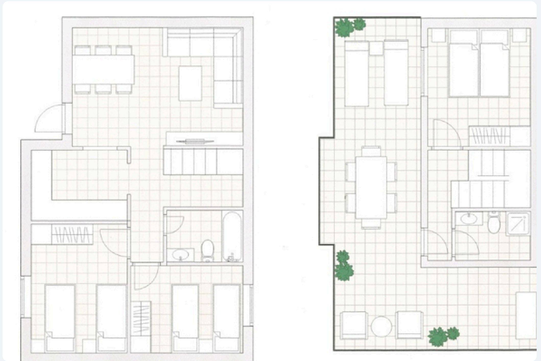
4-roms leilighet, 2. etasje til venstre, 3. etasje til høyre