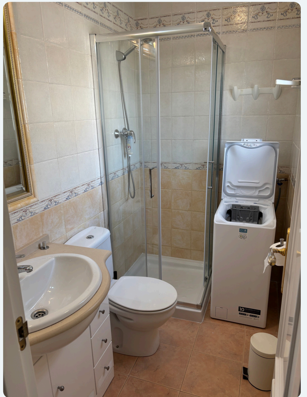
Bilder fra 4-roms