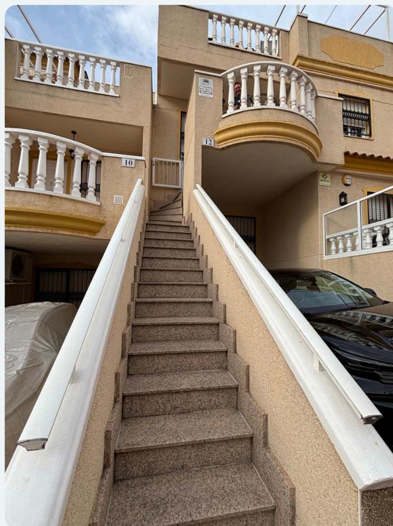
Tilkomst via trapp til 4-romsleiligheten